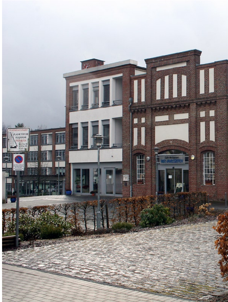
carpe diem ist zur Zeit in Aachen (Foto oben rechts), Göttingen, Meißen, Mettmann, Minden, Niederselters und Wermelskirchen (Foto oben und unten rechts) tätig.

Mittelpunkt jeder Wohngemeinschaft ist der geräumige Wohnraum mit Küche, in der die hausgemachten Mahlzeiten gemeinsam eingenommen werden – eben wie in einer Familie. Wer sein Leben in vollen Zügen genießen will, braucht aber auch Selbstständigkeit. Um sie möglichst lange zu erhalten, stehen den Bewohnern zahlreiche Serviceleistungen zur Verfügung. So fördern hauseigene Physio- und Ergotherapie die individuellen körperlichen und geistigen Ressourcen. Und damit das gesellige Beisammensein in großer Runde mit Familie und Freunden nicht zu kurz kommt, verfügt jeder Senioren-Park auch